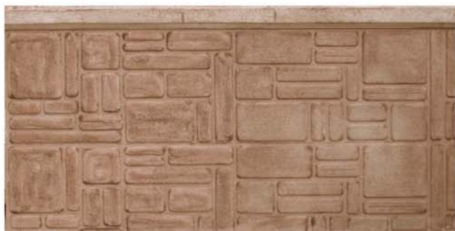
Blocchi in pietra irregolari