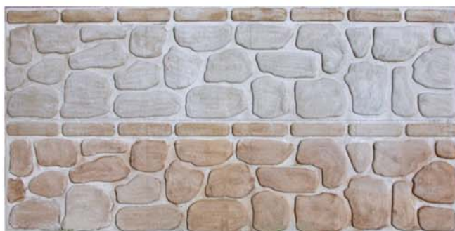
Pietre e mattoni