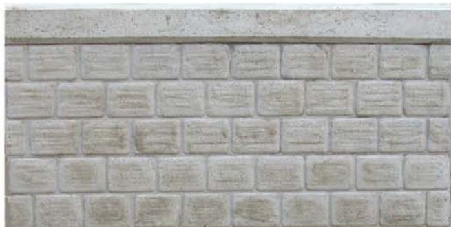
Blocchi in pietra