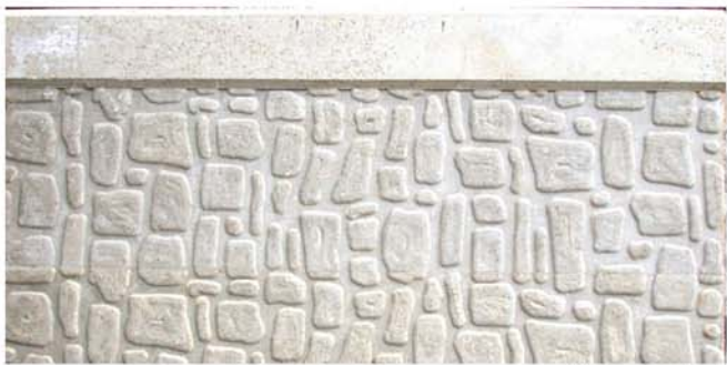
Pietre e mattoni